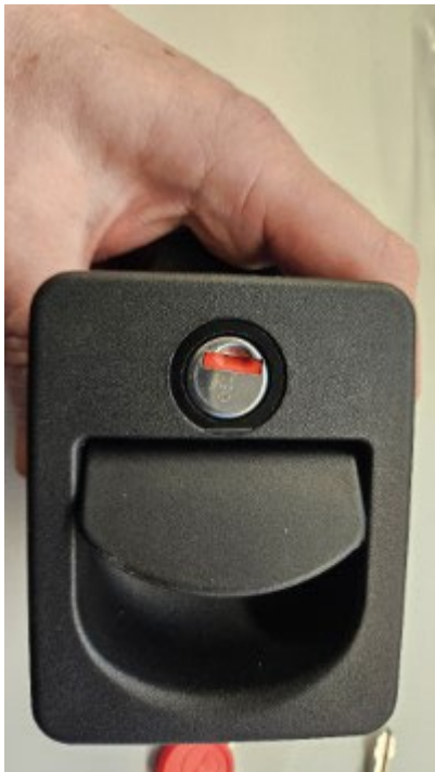
So sollte der Zylinder stehenbleiben, wenn der Schlüssel abgezogen wird