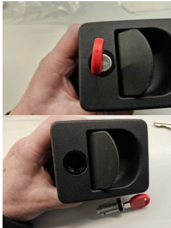
Jetzt den Demontageschlüssel ganz einstecken und den Zylinder damit herausziehen