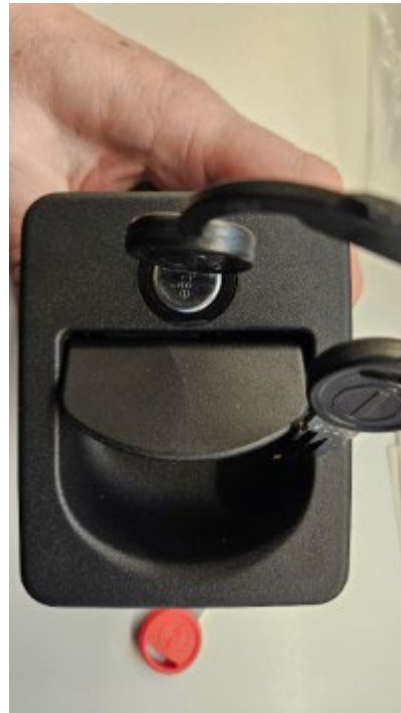
Schlüssel ganz nach links drehen und abziehen